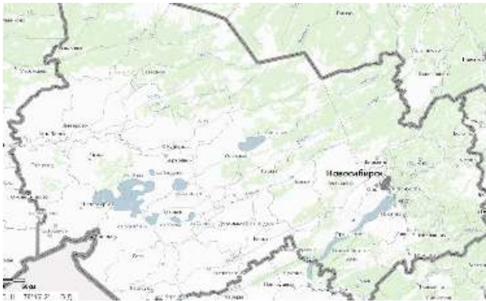
Рисунок 1. Фрагмент карты Новосибирской области

Таким образом, чтобы найти все релевантные статьи, мы должны составить список из всех населенных пунктов Новосибирской области, и производить поиск по каждому из них. Более того, некоторые населенные пункты, существовавшие в прошлом, в настоящее время не существуют или были переименованы. Поэтому, к нашему списку населенных пунктов мы должны добавить еще и населенные пункты, существовавшие в прошлом, а также устаревшие названия населенных пунктов. Все становится еще сложнее, если необходимо найти материалы, в которых упоминаются объекты Новосибирской области, т.е. не только населенные пункты, но и другие географические объекты (реки, озера, улицы, железнодорожные станции и др.). Составить такой список вручную практически невозможно.